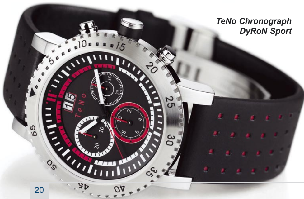
TeNo Chronograph DyRoN Sport