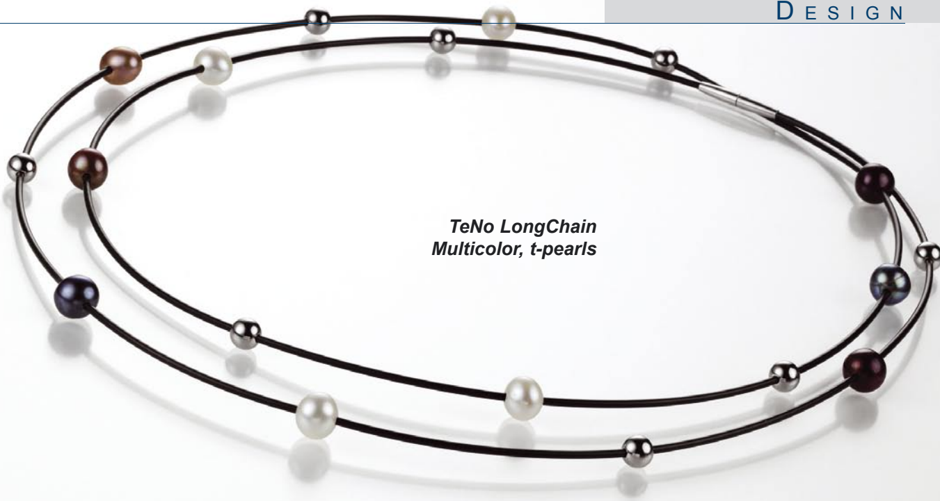
TeNo LongChain Multicolor, t-pearls

A proč právě ušlechtilá ocel? Je vhodná pro celodenní nošení a pro každý věk, pohodlná na údržbu, v kombinaci s barevnými drahokamy nebo brilianty nebo zdobená 18kt zlatem je skutečným klenotem pro společenské příležitosti. Její univerzální charakter ji předurčuje pro uplatnění nejen dnes, ale i v budoucnu, dá se čekat, že ocel nás určitě ještě překvapí. Její čistá řeč tvarů a barev jí dává